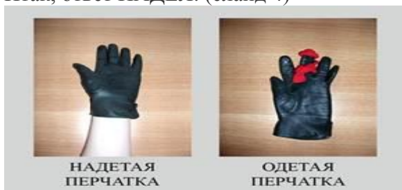
Рис. 1. Иллюстрация-шутка об употреблении слов одеть – надеть